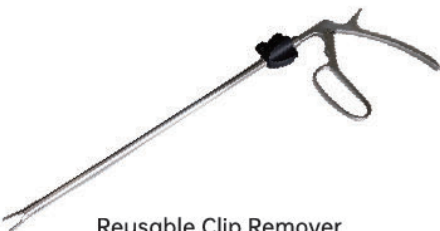
Reusable Clip Remover