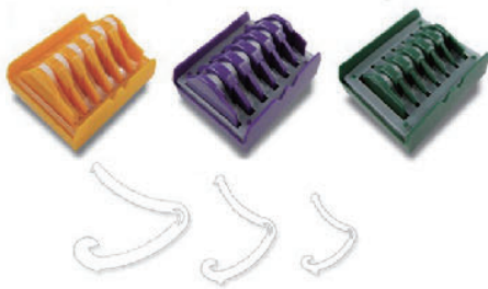
Disposable Ligating Clips