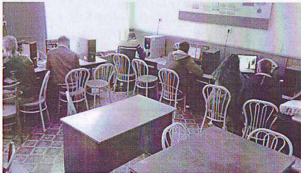
Suprafața 32,87\text{m}^2=33\text{m}^2 Capacitatea este pentru 15 elevi