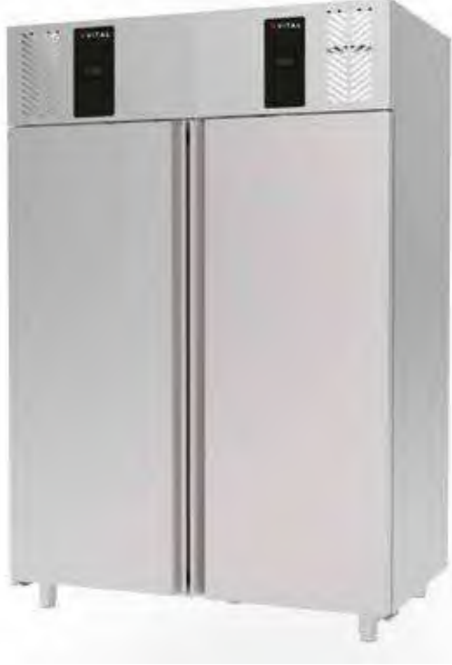
> VBD P140A