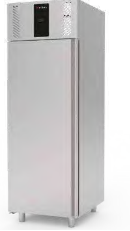
> VBD P700A