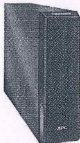
5kVA and 6kVA Battery Pack

Based on the following standards/ Basé sur les normes suivantes :