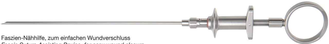
Faszien-Nähhilfe, zum einfachen Wundverschluss Fascia Suture Assisting Device, for easy wound closure