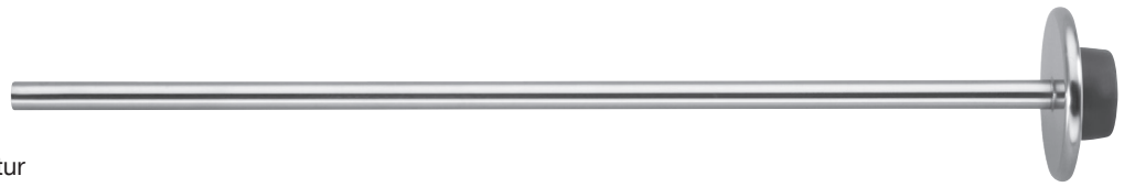
Applikator für Endo-Ligatur Applicator for Endo Ligature