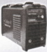
MMA-250 DP/MMA-250 DP