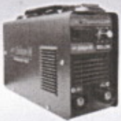
MMA-200 D/MMA-250 D