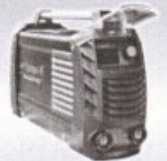
MMA-250 C DPB