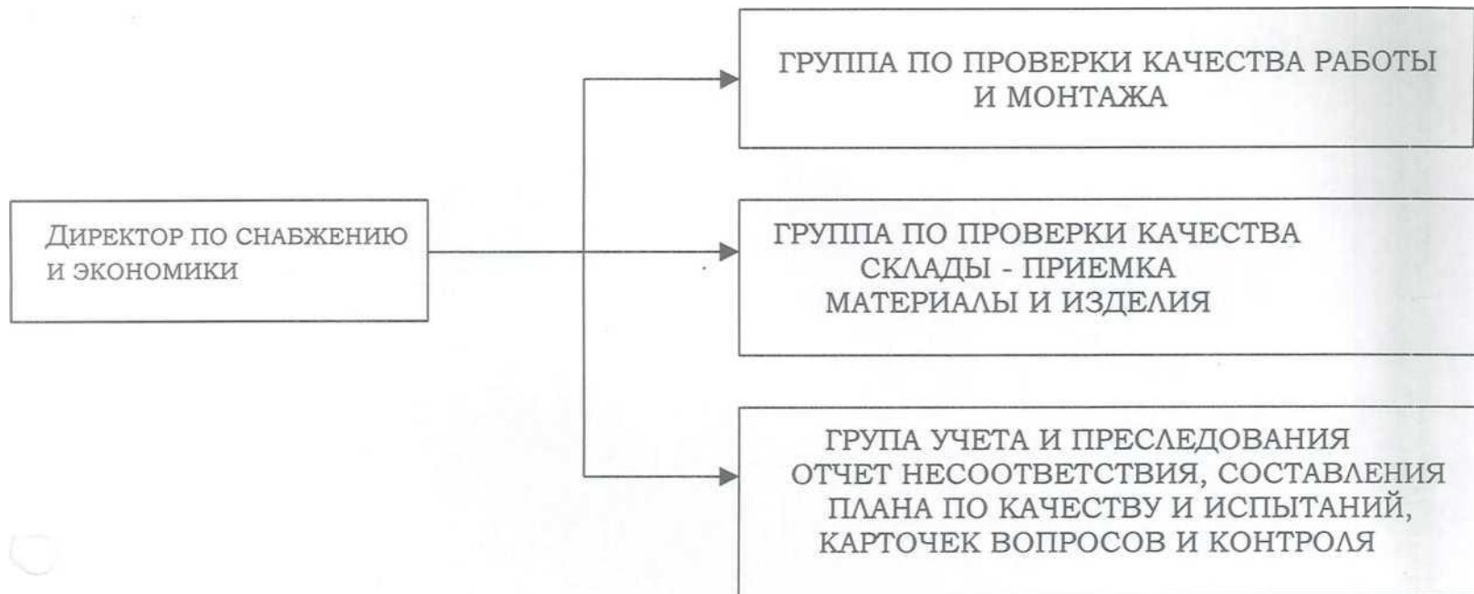
СХЕМА ОТДЕЛА ТЕХНИЧЕСКОГО КОНТРОЛЯ