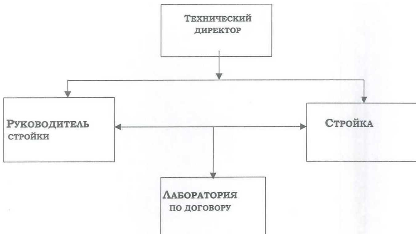
Таблица № 3 СХЕМА ОТДЕЛА ОБЕСПЕСЕНИЯ КАЧЕСТВА