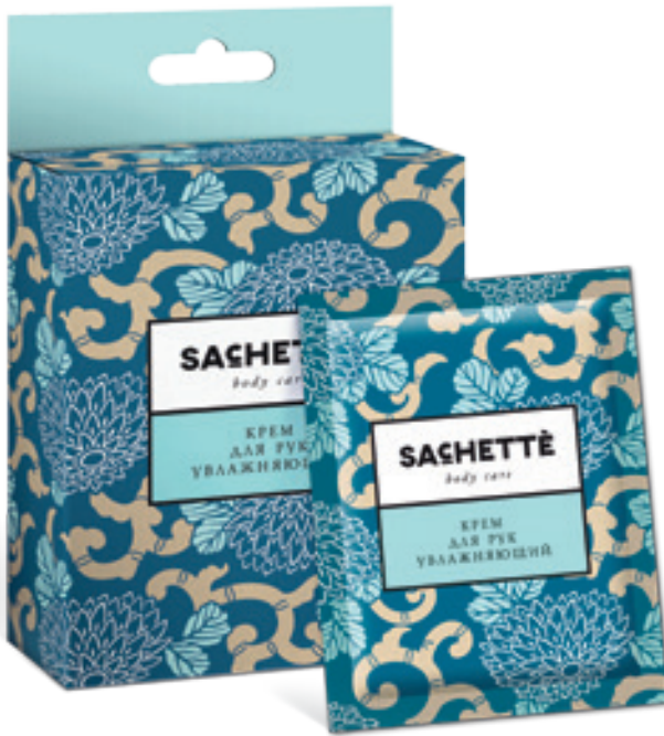
АССОРТИМЕНТ КОЛЛЕКЦИИ «BODY CARE»:

Картонная упаковка – 5 саше по 3, 7 и 10 мл