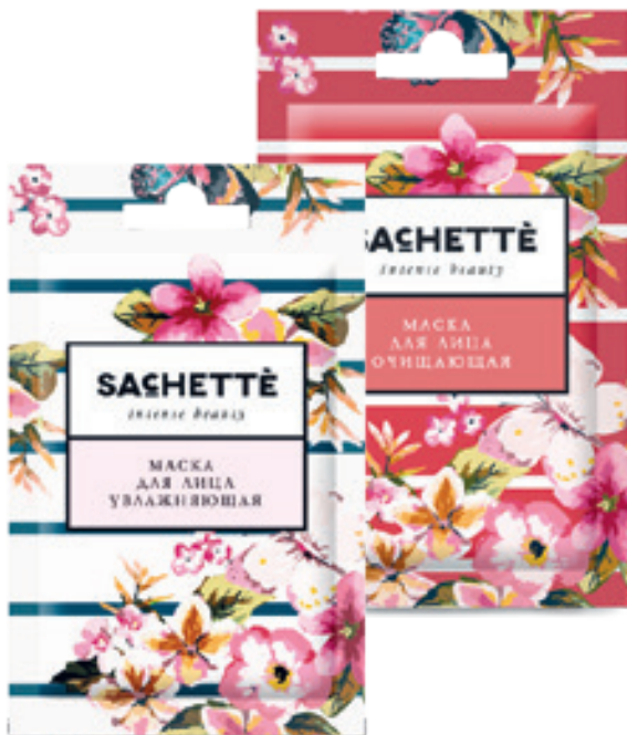
АССОРТИМЕНТ КОЛЛЕКЦИИ «INTENSE BEAUTY»: