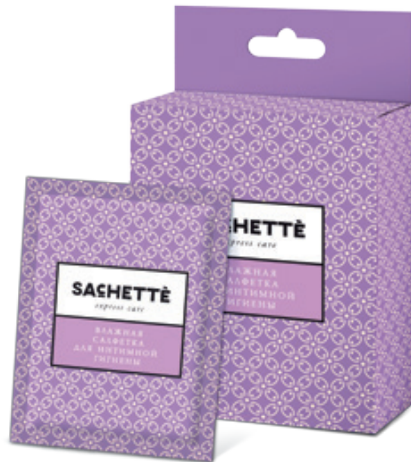
АССОРТИМЕНТ КОЛЛЕКЦИИ «EXPRESS CARE»: