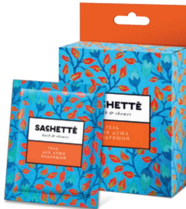
АССОРТИМЕНТ КОЛЛЕКЦИИ «BATH AND SHOWER» ДЛЯ ТЕЛА:

Картонная упаковка – 5 саше по 8 или 10 мл