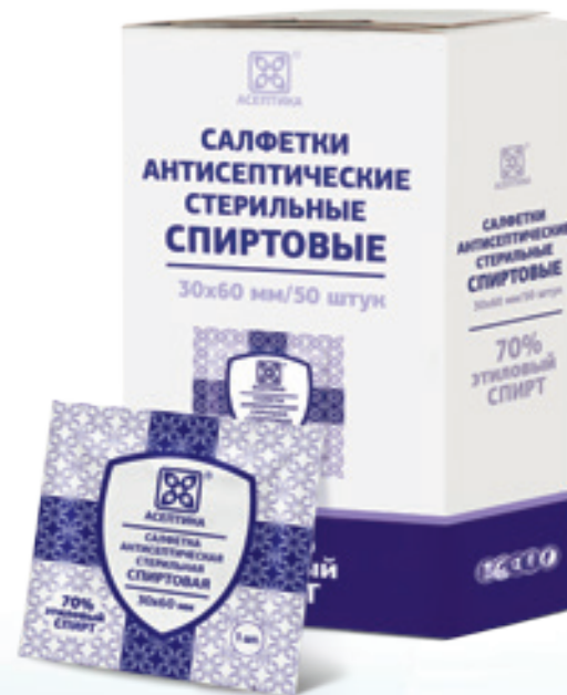
САМЫЕ ВОСТРЕБОВАННЫЕ РАЗМЕРЫ: