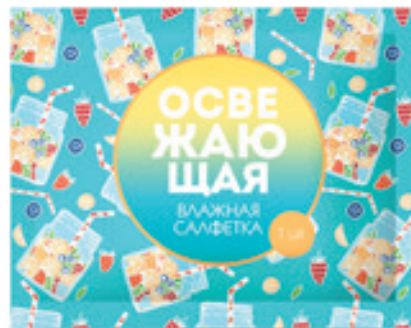
АССОРТИМЕНТ КОСМЕТИЧЕСКИХ СРЕДСТВ В УПАКОВКЕ-САШЕ: