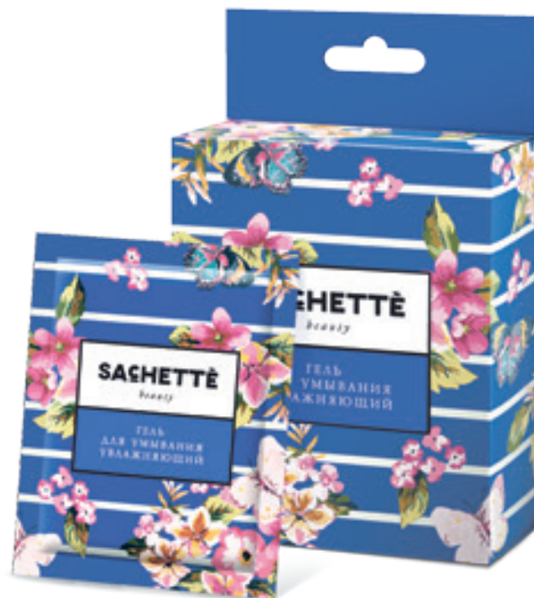
АССОРТИМЕНТ КОЛЛЕКЦИИ «BEAUTY»:

Гель – 6 саше по 5 мл Скраб – 5 саше по 5 мл Тоник-салфетка – 4 шт. Крем – 6 саше по 3 мл