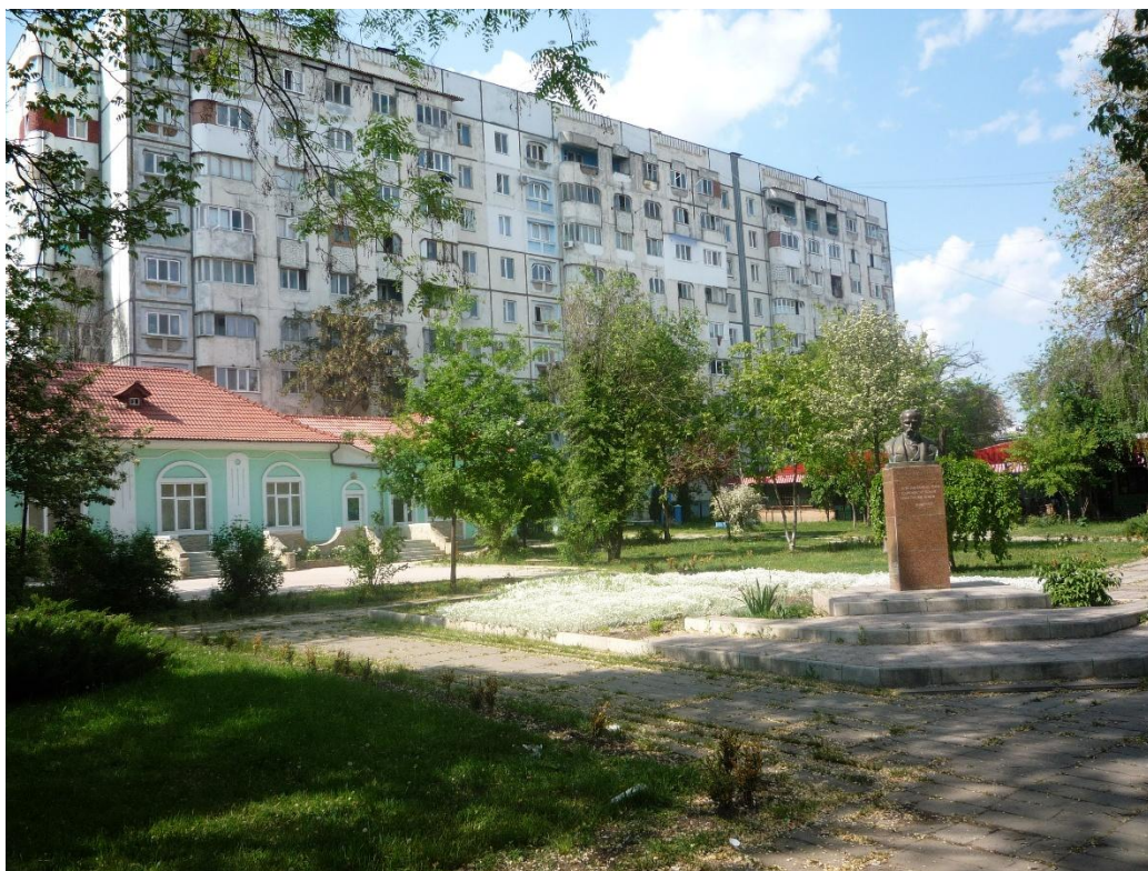
Fig. 12. Bustul lui Taras Șevcenko și scuarul aferent – imagine documentară.