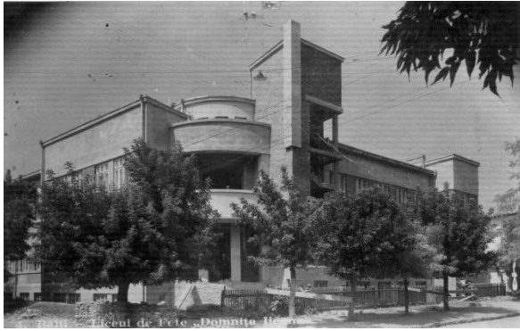
Fig. 6. Liceul de fete „Domnița Ileana” în construcție, 1937.