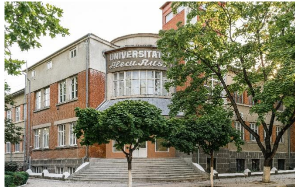
Fig. 7. Corp universitar actual – imagine reprezentativă a ansamblului „Alecu Russo”.