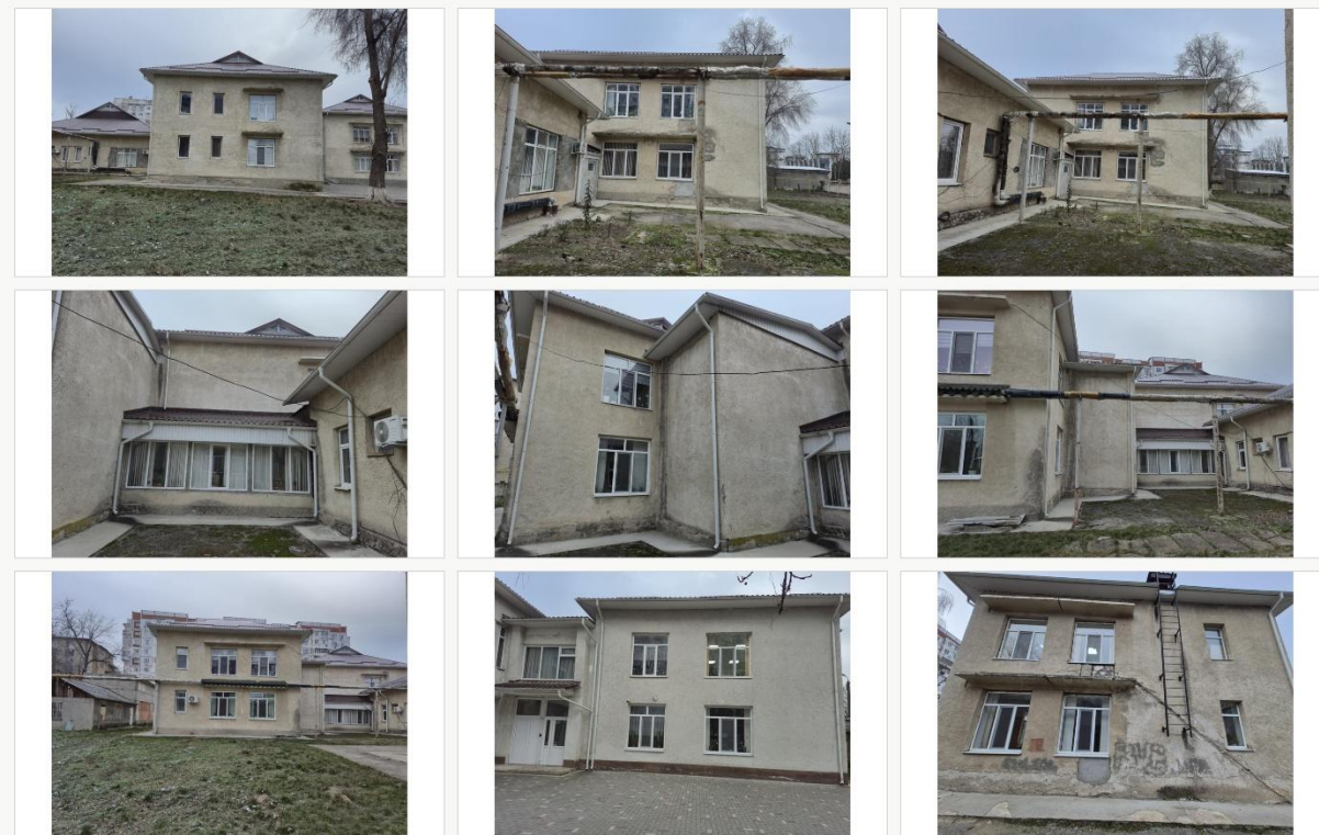
Fig. 13. Corpul Școlii Primare „Mihai Eminescu” de pe str. Voluntarilor – planșă de imagini actuale anexate.

Din perspectivă istorico-arhitecturală, chiar și această memorie instituțională este importantă. Ea indică trecerea clădirii prin cel puțin două regimuri funcționale: unul preșcolar / de protecție socială, legat de mediul industrial, și unul școlar, legat de rețeaua actuală de educație. O asemenea continuitate a funcțiunii educaționale conferă corpului o valoare de memorie locală, independent de lipsa unui statut de monument. Fotografiiile anexate arată un ansamblu fragmentat în volume și corpuri, cu expresie funcțională și transformări succesive, ceea ce este compatibil cu o istorie de adaptare și extindere etapizată. Pentru o reconstituire completă ar fi necesară consultarea arhivei întreprinderii „Răut”, a dosarelor cadastrale și a arhivei fostelor instituții preșcolare sau școlare care au utilizat acest corp.