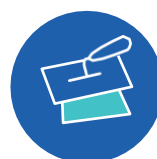
Pastă de rosturi