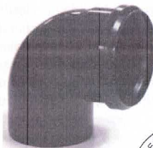
Cot la 87° fonoizolant