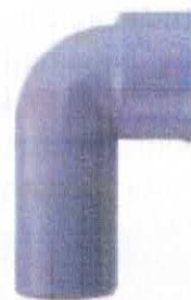
Curba tehnică fără dop

o) curba tehnică cu dop fără garnitură pentru racordare obiecte sanitare din PP în gama de dimensiuni De 32 și 40 mm;