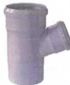
Ramificație redusă la 67°

e) ramificație redusă din PP la 67°30' pentru gama de dimensiuni De 40/32, 50/40, 75/40, 75/50, 110/40, 110/50, 110/75, 125/50, 125/110, 160/110 și 160/125 mm;