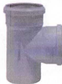
Ramificație egală la 87°

f) ramificație egală din PP la 87°30' pentru gama de dimensiuni De 32/32, 40/40, 50/50, 75/75, 110/110, 125/125 și 160/160 mm;