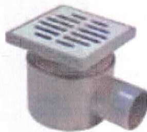
Sifon pardoseală cu o ieșire D50mm