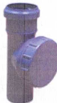
Piesă de curățire cu dop filetat

m) piesă de curățire cu dop filetat din PP în gama de dimensiuni De 50, 75, 110, 125 și 160 mm;