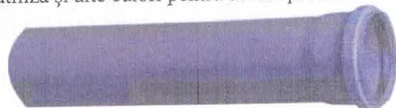
Vedere generală țevi din PP.

Țevile și fittingurile din PP sunt de culoare gri, alb și maro, au luciu superficial și culoarea este stabilizată la UV. La cerere se pot utiliza și alte culori pentru aceste produse.