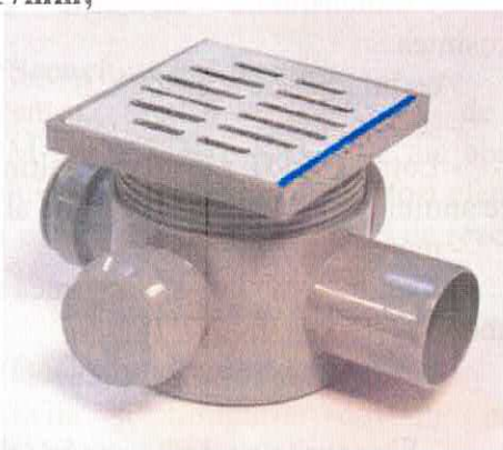
Sifon pardoseală 3 intrări D40mm și o ieșire D50mm