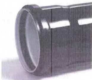
Țeavă dublustrat fonoizolantă

Țevile și fittingurile fonoizolante se produc în gama de dimensiuni 32÷160mm.