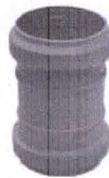
Manson din PP

l) manson din PP în gama de dimensiuni De 32, 40, 50, 75, 110, 125 și 160mm;