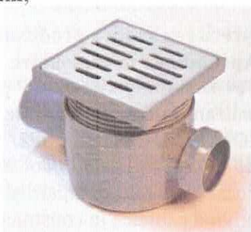
Sifon pardoseală cu o intrare D40mm și o ieșire D50mm