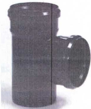
Ramificație la 87° fonoizolantă