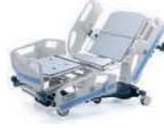
SANTÉ 8000 B