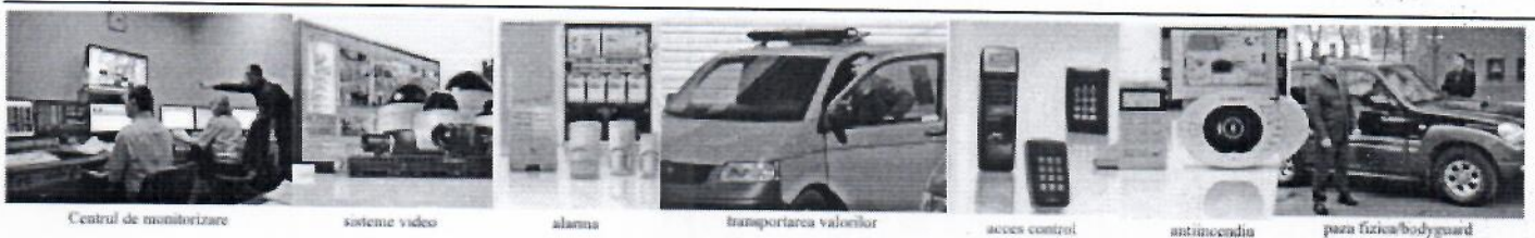
Centrul de monitorizare