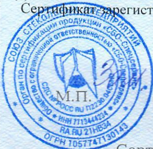
Схема сертификации: 2с

Сертификат зарегистрирован на сайте СДС № РОСС RU.П2230.04СБНО www.sbosp.ru