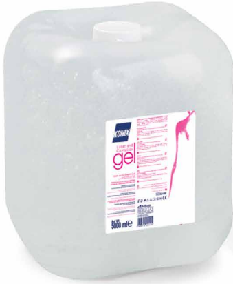
REF: CLG-0003 Y0000.130.0003 Cubitainer (Soft Pack)

LAZER&KAVİSYON JELİ / GEL DE LASER ESTHETIQUE&CAVITATION/ GEL PARA LÁSER Y CAVITACION