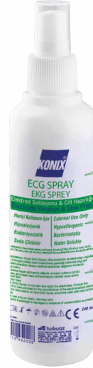
REF: ECG-0007 Y0000.111.0001 240 ml