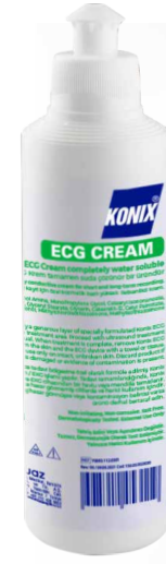
REF: ECG-0008 Y0000.112.0001 250 ml