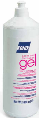
REF: CLG-0002 Y0000.130.0006 1000 ml