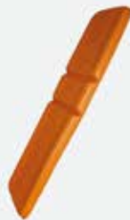
Presli (Yapıştırılmalı) Minder - ES 130 Pressed Mattress - ES-130