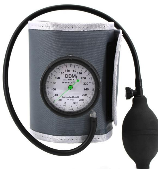
Visuel Tensiomètre MANO CUFF adulte