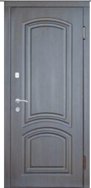
Foto: Ușă metalică cu două plăci din MDF.