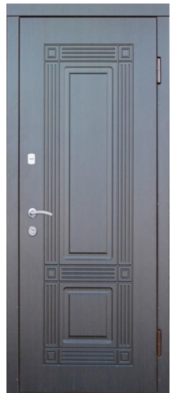
Foto: Ușă metalică cu două plăci din MDF

Culoare obligatoriu conform RAL-7048 /Pearl mouse grey