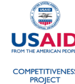
Proiectul de competitivitate în Moldova finanțat de USAID și Guvernul Suediei