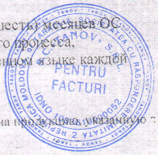
Схема сертификации 2+. Периодическая оценка осуществляется один раз в 6 (шесть) месяцев ОС „CertMatCon”. Сертификат действителен в случае обеспечения технологического процесса, установленного "SUPRATEN" S.A. и обеспечения информацией на государственном языке каждой упаковки продукции, согласно действующему законодательству. Договор на оказание услуг № 406 от 06.08.2014.

Обладатель данного сертификата обязан наносить национальный знак соответствия SM на продукцию, указанную в настоящем сертификате