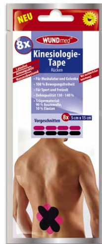
Kinesiologie Tape Rücken Art. Nr.: 04-049 EAN: 4260206626671 Kartoninhalt: 12