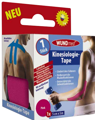
Kinesiologie Tape Pink Art. Nr.: 04-040 EAN: 4260206625353 Kartoninhalt: 6