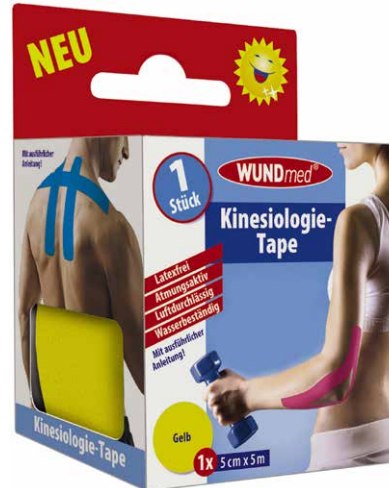
Kinesiologie Tape Gelb Art. Nr.: 04-039 EAN: 4260206625346 Kartoninhalt: 6