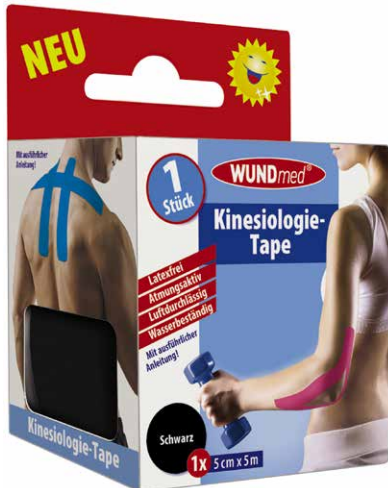
Kinesiologie Tape Schwarz Art. Nr.: 04-038 EAN: 4260206625339 Kartoninhalt: 6