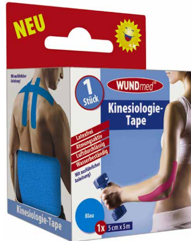
Kinesiologie Tape Blau Art. Nr.: 04-041 EAN: 4260206625360 Kartoninhalt: 6