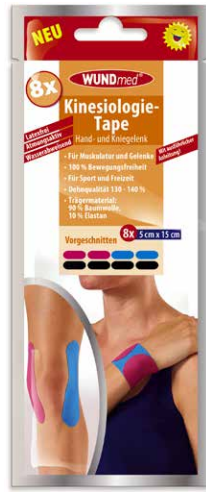
Kinesiologie Tape Hand- und Kniegelenk Art. Nr.: 04-048 EAN: 4260206626664 Kartoninhalt: 12