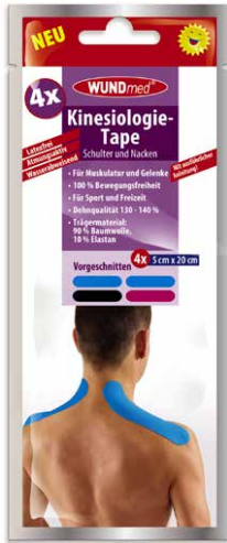
Kinesiologie Tape Schulter und Nacken Art. Nr.: 04-047 EAN: 4260206626657 Kartoninhalt: 12