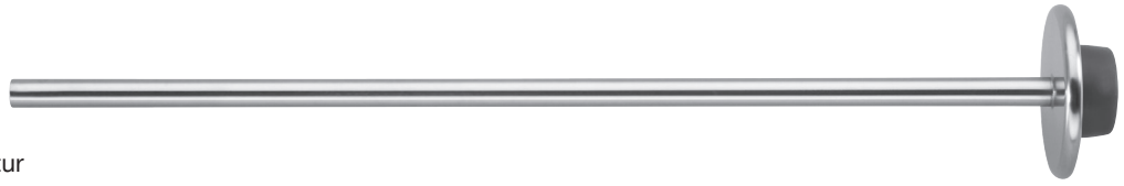
Applikator für Endo-Ligatur Applicator for Endo Ligature