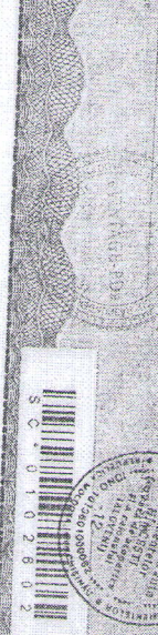
In certificatul de inofensivitate nr. 116 SC 0102602

Inspectoratul Național de Protecție și Control al Produselor Alimentare 13 August 2020