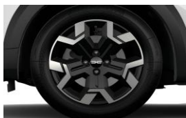
Jante aliaj 16", design Tamia

La livrare, autoturismul este echipat cu anvelope de vara.