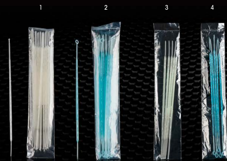
ANSE PER INOCULAZIONE INOCULATION LOOPS