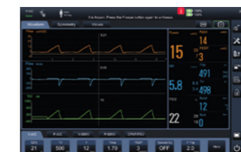
Интерфейс измерения формы волны