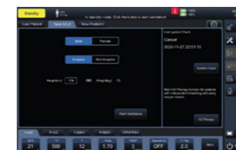
Интерфейс данных пациента

Технология IntelliSynTec: автоматически регулирует оптимальные значения [триггера выдоха] в зависимости от характеристик легких пациента, что делает дыхание более комфортным и убирает необходимость часто корректировать настройки аппарата во время лечения. Это эффективно снижает нагрузку на медработников и обеспечивает отличную синхронизацию.