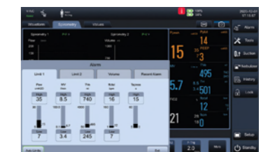
Предел автоматического сигнала тревоги

Благодаря интуитивно понятному дизайну пользовательского интерфейса V3, для настройки параметров вентиляции требуется всего два шага. Функциональная схема испытана клинически, вы получите то, что необходимо.