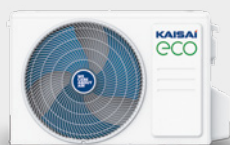
Външно тяло КЕХ