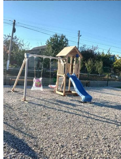
Lucrări la “Reconstrucția parcului din s.Grătiești, mun. Chișinău-Construcția stadionului multifuncțional 32x20