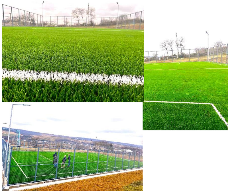
Construcția terenului de joacă și sport str. Serghei Lazo, or. Ștefan Vodă