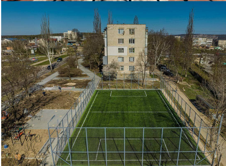
Construcția terenului de minifotbal s.Slobozia r-ul Ștefan Voda