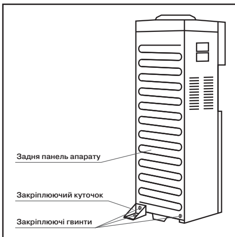
Мал. 2. Фіксація апарату

Переконайтеся в тому, що параметри електромережі відповідають параметрам, зазначеним на табличці з технічними даними, розташованій на задній стінці апарату.