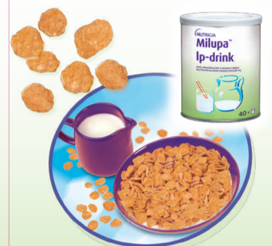
Serving suggestion/Servenvorschlag/Serveersuggestie/ Suggerazione di presentazione/L'immagine ha il solo scopo di presentare il prodotto

Milupa Ip-flakes can be eaten as a snack on its own or combined with a suitable milk replacement e.g. Milupa Ip-drink