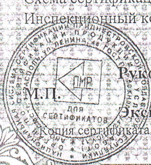
Схема сертификации За. Условия хранения и сроки годности указаны на упаковке. Инспекционный контроль осуществляет один раз в год ОС АНО ЦСМС