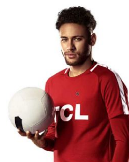
Ambasador de brand Neymar Jr.