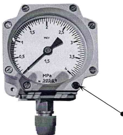
Figura 2. Locurile aplicării marcajului metrologic de verificare