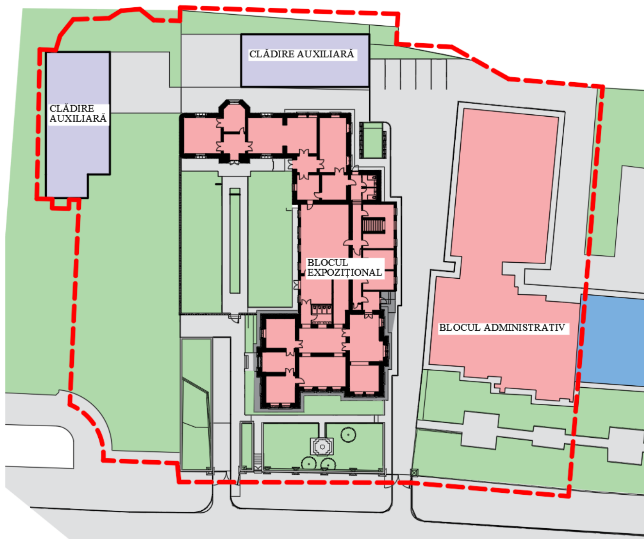
Fig.1. Planul complexului istoric de clădiri de pe adresa cu statut de monument str. Alexei Mateevici, 79 (stare actuală).