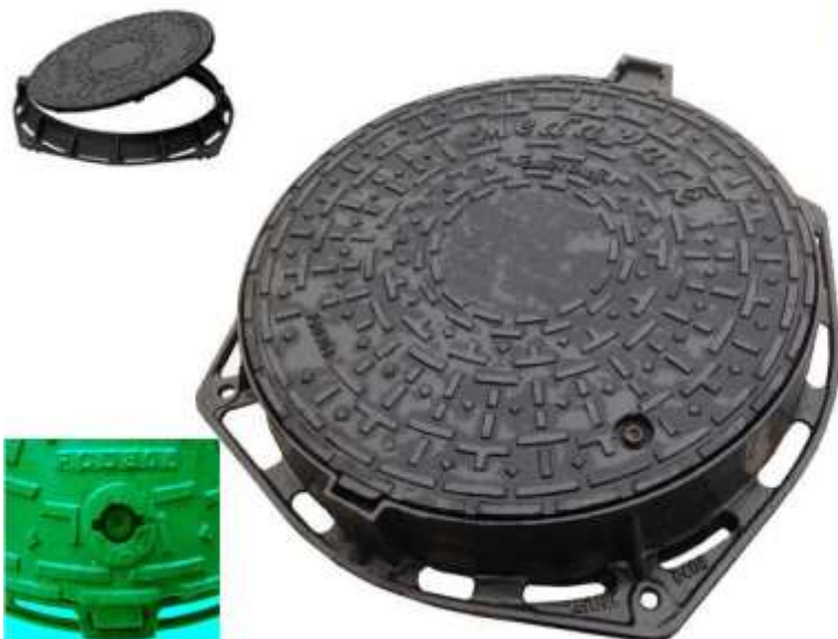
Grătar fontă clasa C-250/D 400