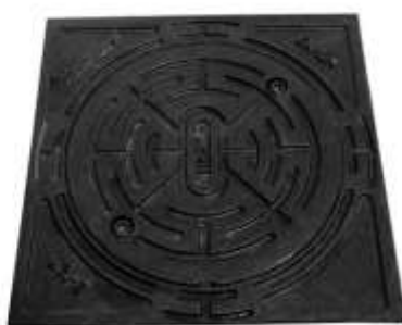
Capac fontă clasa C-250/D 400