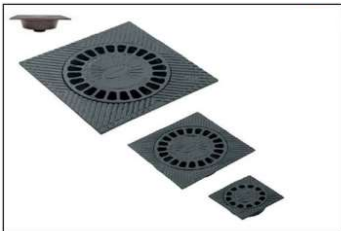
Capac și grătar fontă pentru tub PVC DN 315