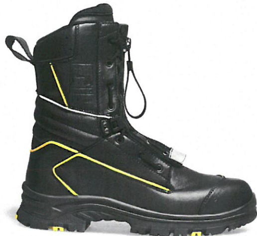
RUBER OUTSOLE HEATPROOF „BLAST”