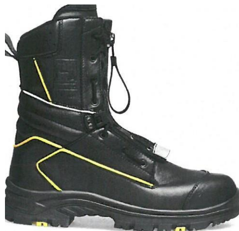
TALPĂ EXTERIOARĂ "BLAST"