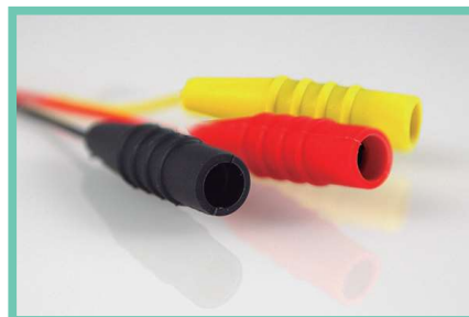
K-150, KS-150, KF-150, KFS-150