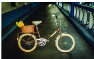
Pegas, un cal înaripat și ambițios. GALERIE FOTO