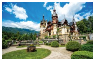
GALERIE FOTO: Turism, România@100