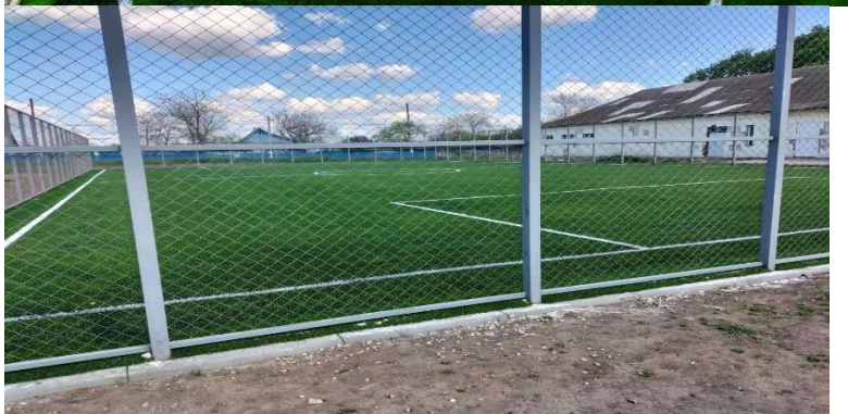
Reabilitarea terenului de sport al Gimnaziului din s. Telița r-nul Anenii Noi