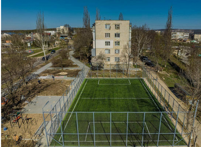
Construcția terenului de minifotbal s.Slobozia r-ul Ștefan Voda