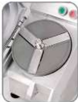
Use different discs for your needs