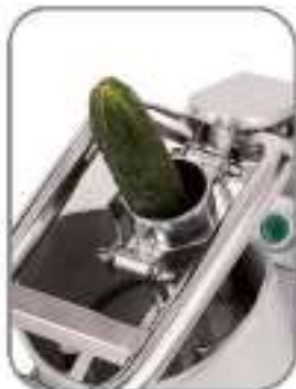
Small inlet for long vegetables like carrot, cucumber up to 65mm