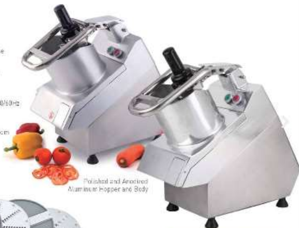
Polished and Anodized Aluminum Hopper and Body