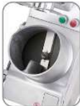
Larger inlet up to 91.5mm