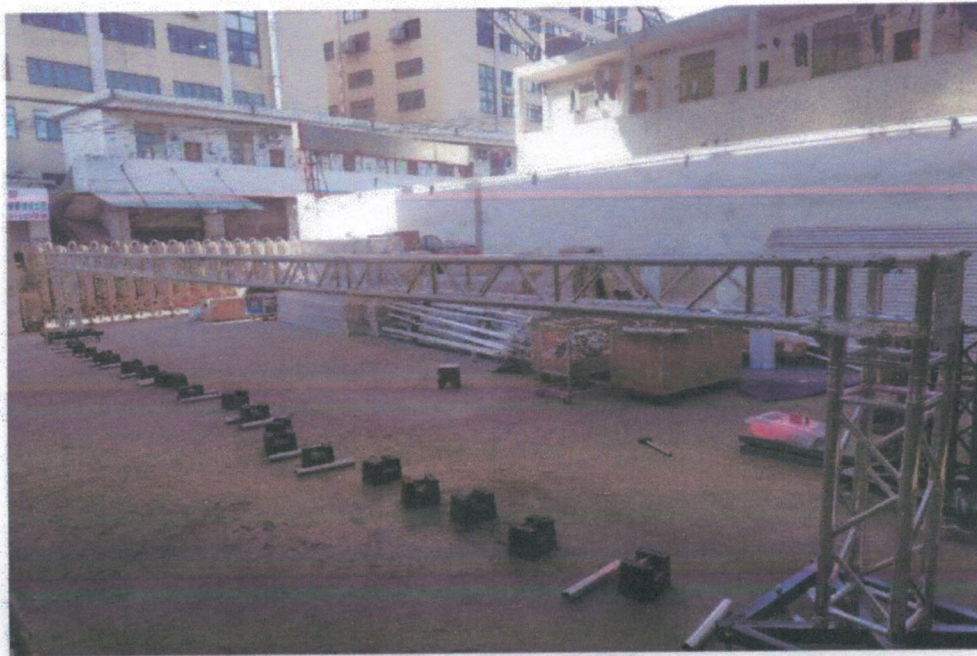
DSE Stage Truss B-300