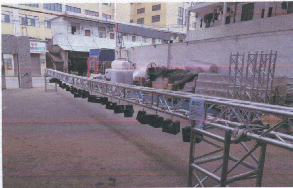
In testing( DSE Stage Truss B-300)