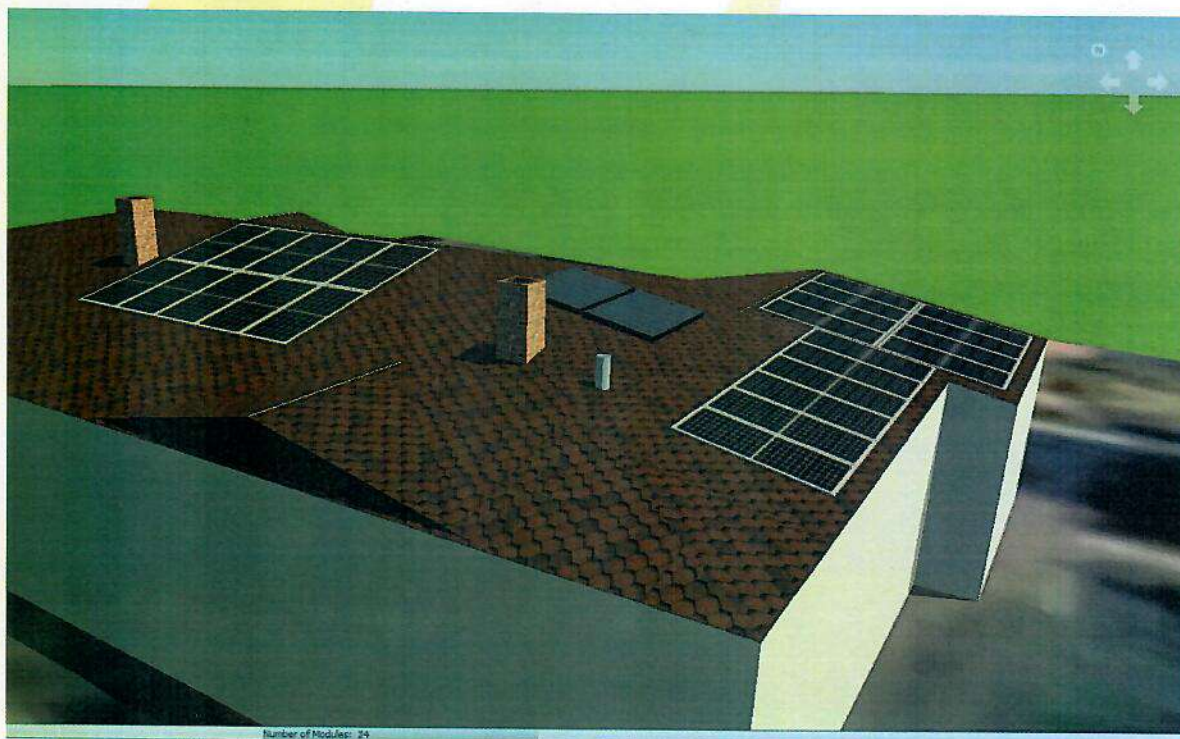
Vederea cu amplasarea panaorilor fotovoltaice

*Nota, amplasarea panourile poate surveni modificari, fapt ce nu afectează puterea instalata a intregului sistem fotovoltaic.