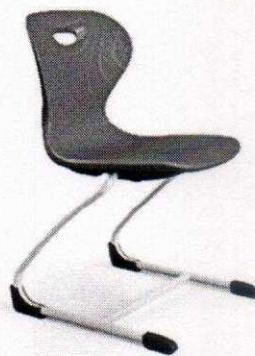
Felisa Z legged chair D03-11212