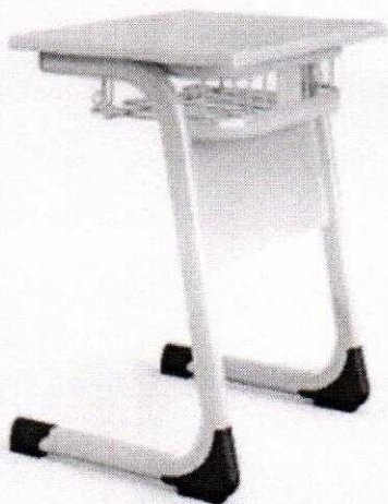
Elegan single desk with metal front panel D01-15131