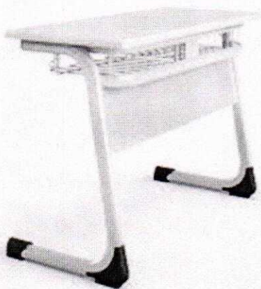
Elegan double desk with metal front panel D01-25131