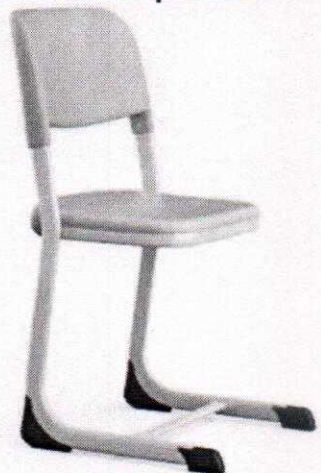
D03-13111 Elegan pp chair