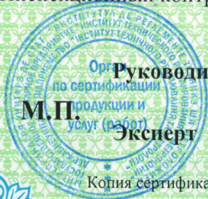
Схема сертификации № 3а. Инспекционный контроль осуществляет один раз в год ОС ГУП "ИТРМ".