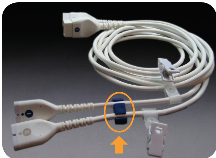
Blue clip can join together two cables.

DO NOT DISCARD! Reusable Sensor Cables are intended for multiple use. For use with SomaSensor Models SAFB-SM and SPFB. (Sensor is designed for single-patient use. Reuse of the sensor may cause inaccurate readings.)