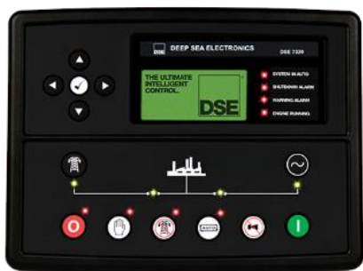
STANDARD DSE 6120 UK

- Componente instalate in cutie metalica, la interior, vopsit in camp electrostatic si protejat impotriva coroziei, usa cu acces facil.