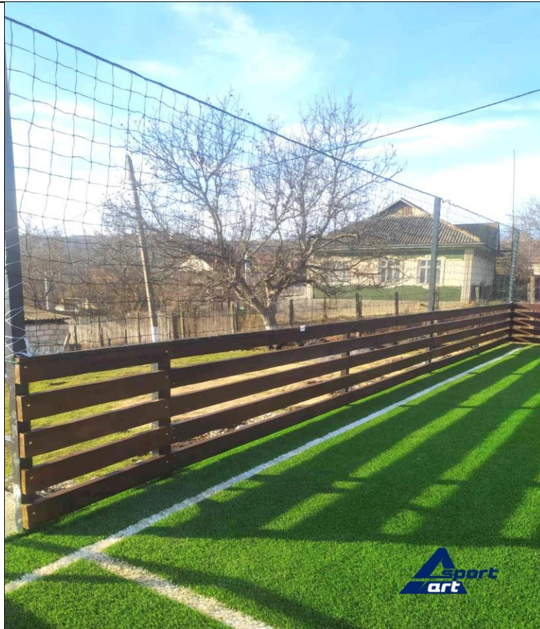
Amenajarea terenului de sport multifuncțional în satul Chioselia Mare, raionul Cahul