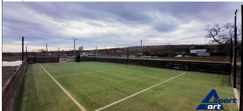
Amenajarea stadionului 24mx12m cu acoperire artificială 30mm PVC

Primăria satului Chioselia Mare, raionul Cahul