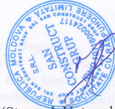
(Stempel, Unterschrift PT)