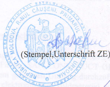
(Stempel, Unterschrift ZE)