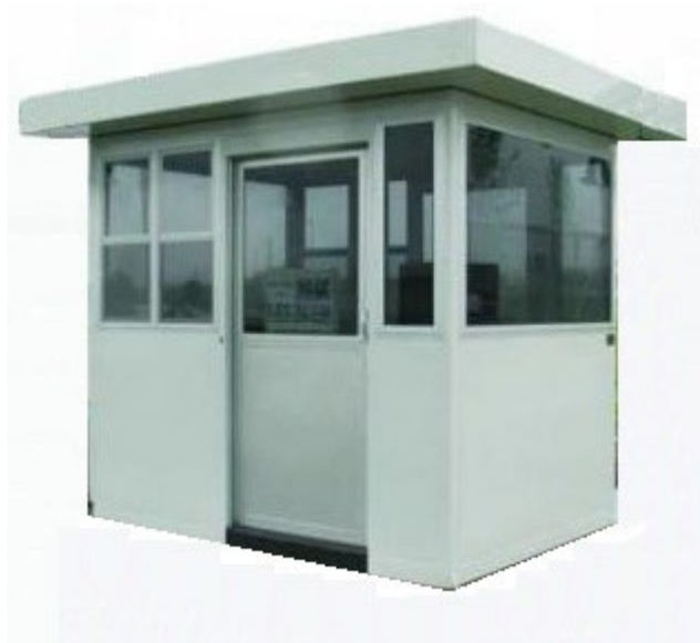
Container modular 2,5m x 2m gata echipat